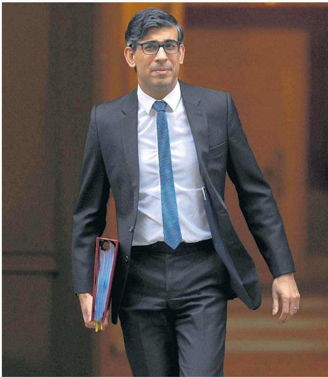
El primer ministre britànic, Rishi Sunak.

El 16% de la població forma part de minories ètniques, que estan infrarepresentades a la política institucional