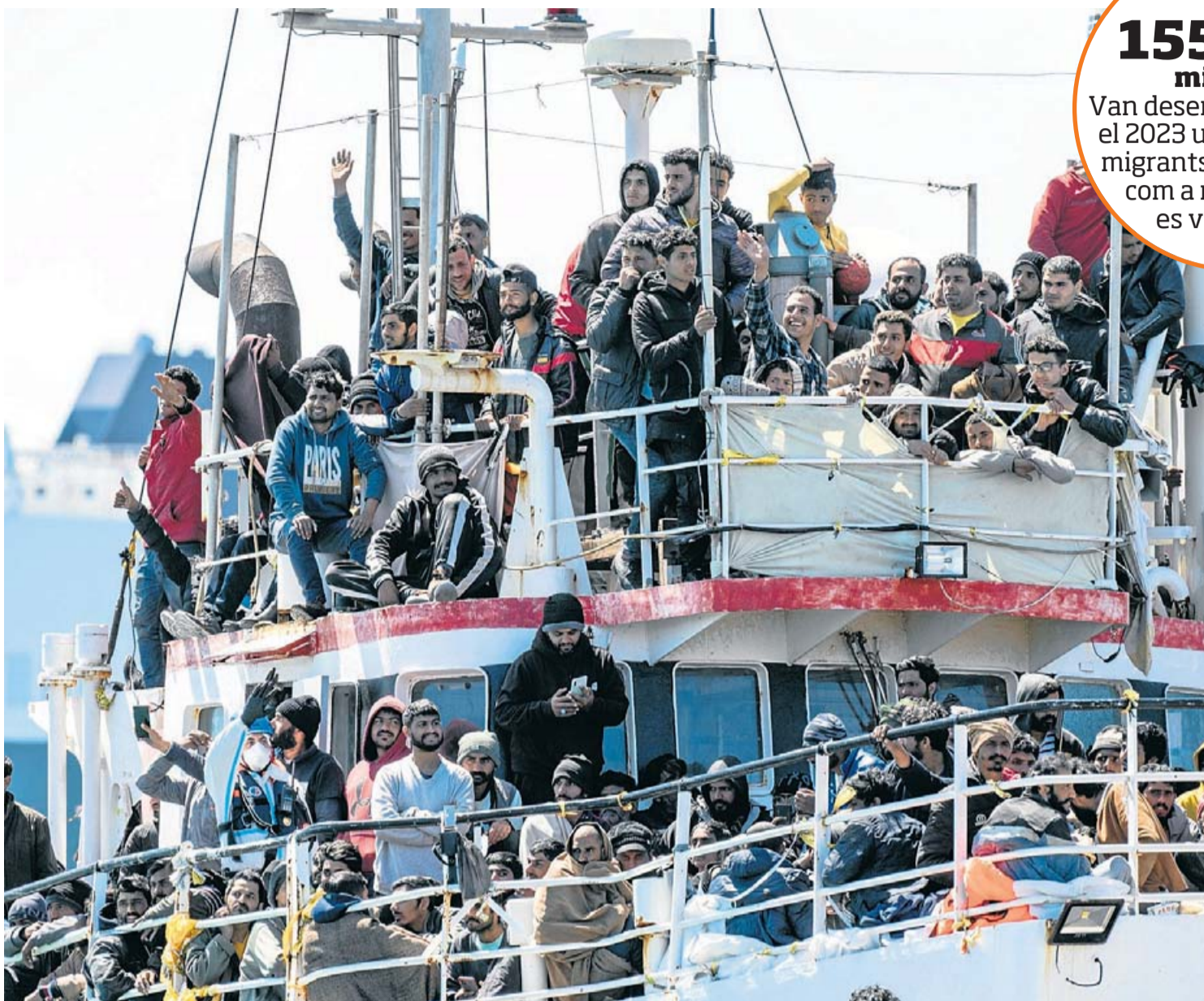
600 migrants a bord d'un vaixell pesquer arribant al port de Catània l'abril de l'any passat.

155.000 migrants Van desembarcar a Itàlia el 2023 un 33% més de migrants que el 2022. I com a mínim 2.500 es van ofegar