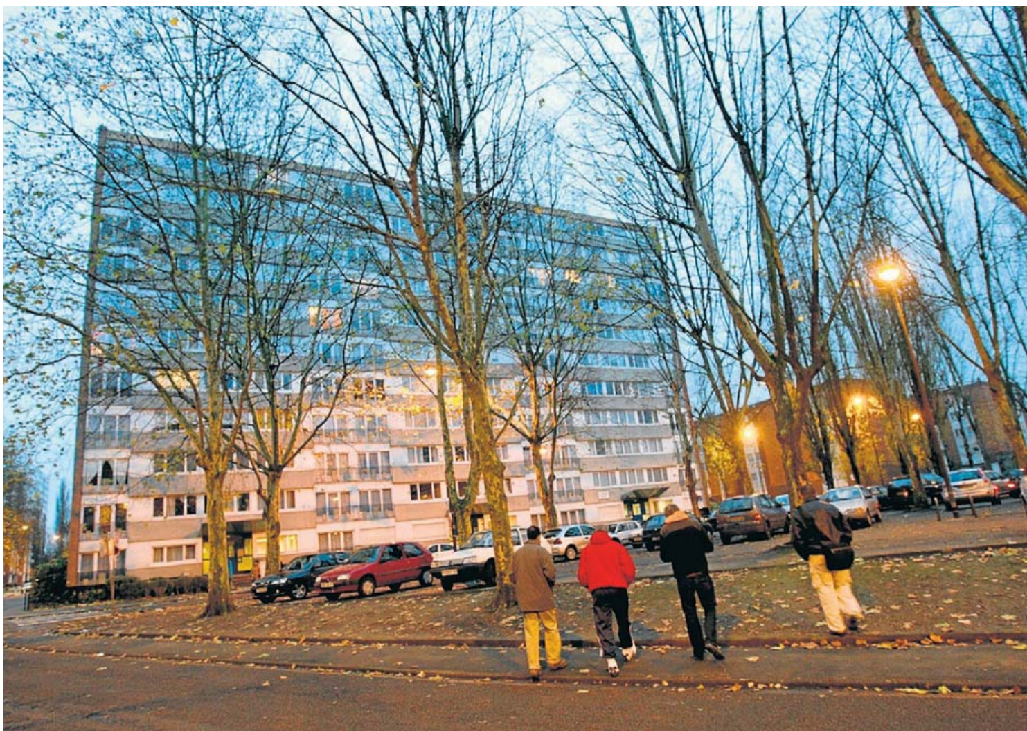
Gent passejant en una 'banlieue' a les afores de Roubaix, a França.

El fenomen de les banlieues , les revoltes per la mort de joves d'origen immigrant a mans de la policia, els atacs terroristes jihadistes i una política de laïcitat que ha portat el govern d'Emmanuel Macron a prohibir els vels i les túniques musulmanes a les escoles han tornat a posar al centre del debat polític la qüestió de la immigració, un dels grans problemes de França: la dificultat per integrar una part d'estrangers, especialment els d'origen àrab. L'extrema dreta, que fa de la immigració el seu leitmotiv , agita sovint el debat. “La dreta i l'extrema dreta fan dels immigrants els caps de turc de totes les dificultats socials i els mitjans de dretes alimenten els estereotips”, critica François Dubet.